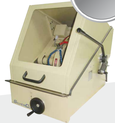
Serie VN-300M Tischtrennmaschine