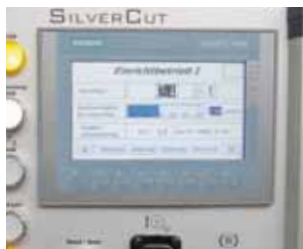
Панель управления с сенсорным экраном и джойстиком для сервооси отрезного диска.

Полностью автоматическая отрезная система типа RSP-400 N предназначена для полностью автоматической комплектки направляющих, винтов, труб и других прутковых заготовок путем абразивной резки влажным способом.