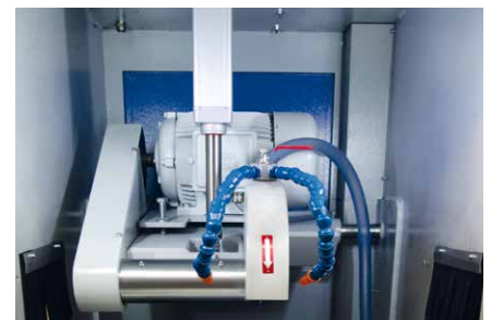
Einblick in den Maschineninnenraum.