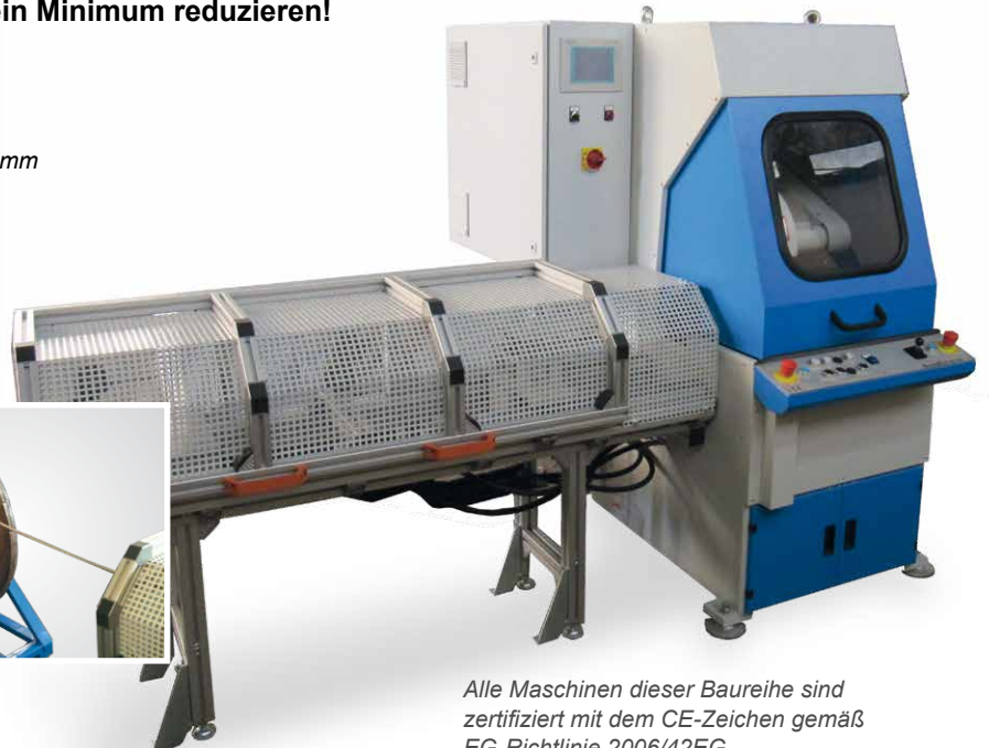
Alle Maschinen dieser Baureihe sind zertifiziert mit dem CE-Zeichen gemäß EG-Richtlinie 2006/42EG.