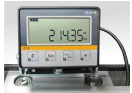
Anzeigerät für digitalen Werkstückanschlag mit Positionier-Auflösung 0,05 mm.